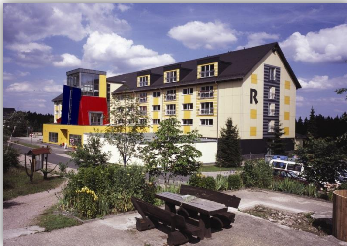
AWO SANO Ferienzentrum Oberhof