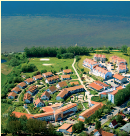
Das Familienferiendorf an Salzhaff und Ostsee