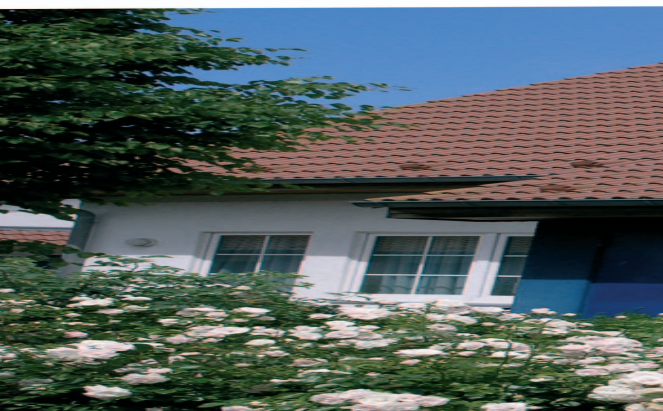
Ferienhaus im Familienferiendorf Rerik