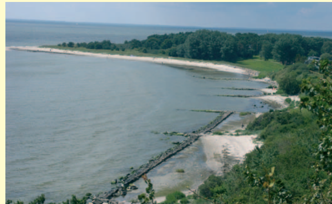
Blick vom Bakenberg