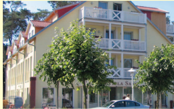
Familienhotel «VILLA SANO»