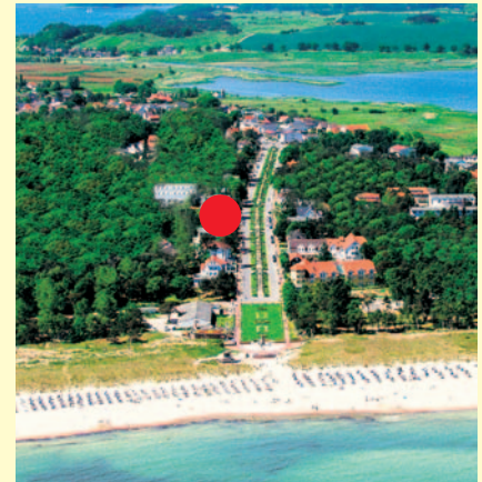
Strand von Baabe roter Punkt: Lage des Hotels