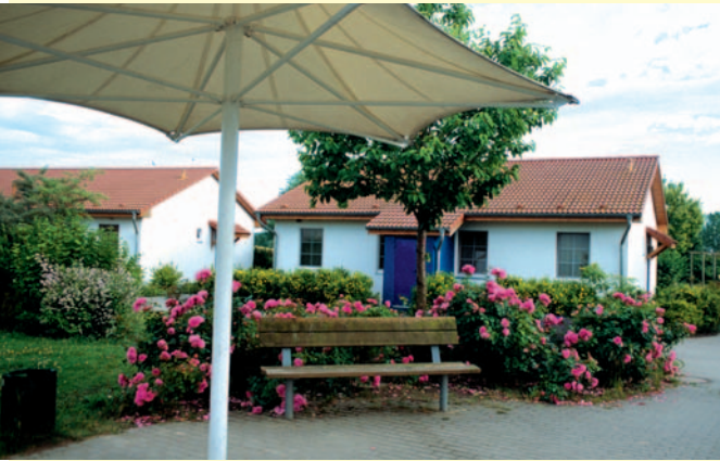
Im Familienferiendorf der AWO SANO