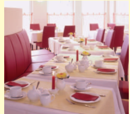
Restaurant im Familienhotel «Villa Sano» in Baabe/Rügen