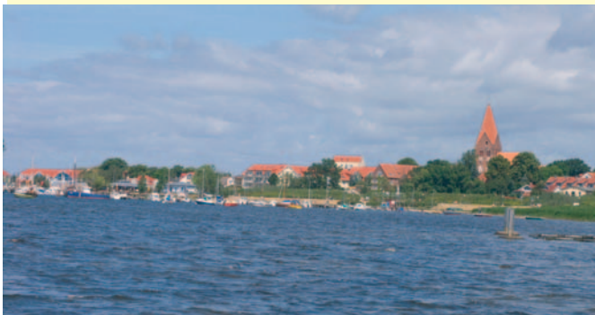
Rerik vom Salzhaff aus gesehen