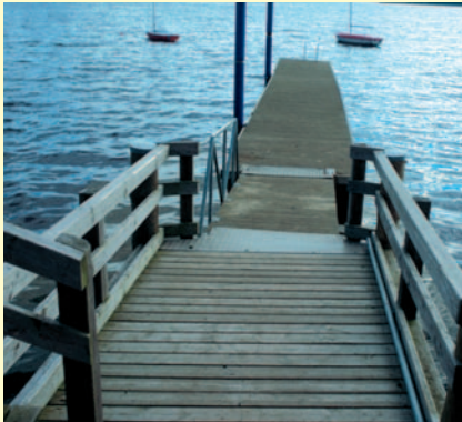
Rollstuhlgerechter Badesteg in Rerik