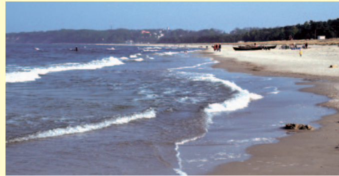
Strand von Baabe